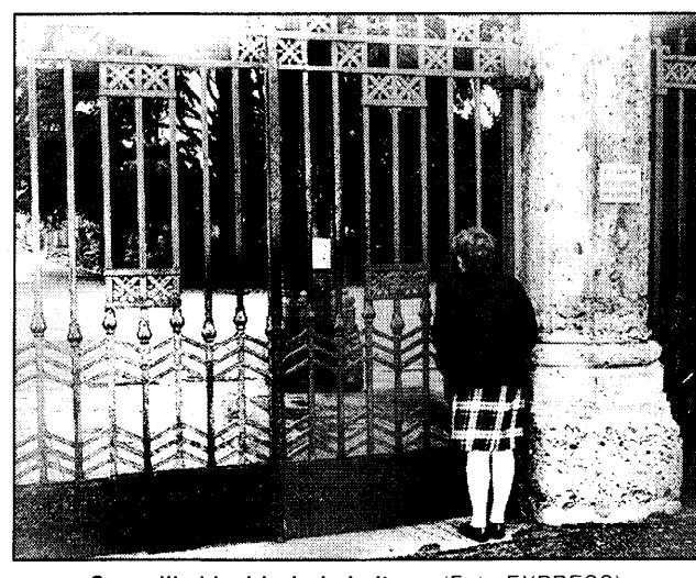
Cancelli chiusi ieri al cimitero.

Qualche cittadino all'oscuro della decisione si è recato sul posto e dopo aver letto l'avviso affisso sul cancello è stato colto da sorpresa. Da ieri il cimitero civico di Colognola - resterà chiuso al pubblico tutti i mercoledì pomeriggio. La decisione è stata presa dalla Giunta a fine luglio e motivata da alcune ragioni di ordine organizzativo. Ogni anno infatti vengono effettuate mediamente mille operazioni di movimentazione delle salme (promosse d'ufficio o su istanza degli interessati), che devono essere effettuate seguendo precise precauzioni igienico-sanitarie. Ma il tempo a disposizione per effettuare in generale la polizia mortuaria è ristretto essendo il cimitero aperto al pubblico tutti i giorni feriali e festivi, dalle 8 alle 12 e dalle 14 alle 17 (18 nel periodo estivo). Le operazioni vengono così concentrate durante la chiusura. Questo comporta alcuni problemi procedurali oltre che di gestione del personale. E allora prassi diffusa nella maggior parte dei Comuni quella di chiudere al pubblico i cimiteri con cadenza periodica. Oltretutto il mercoledì pomeriggio non vengono attualmente effettuati funerali sul nostro territorio comunale. La chiusu-