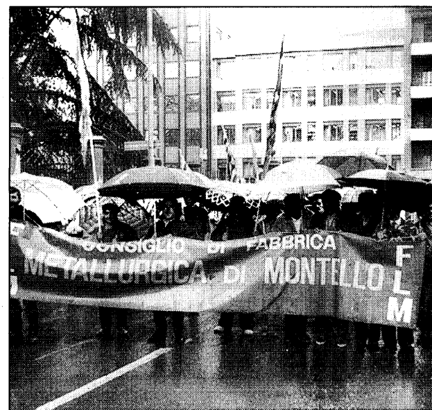
La manifestazione dei lavoratori della Montello.