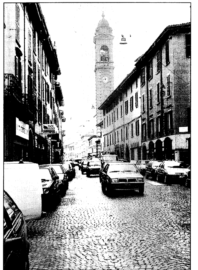
Un'immagine di via Borgo Palazzo.